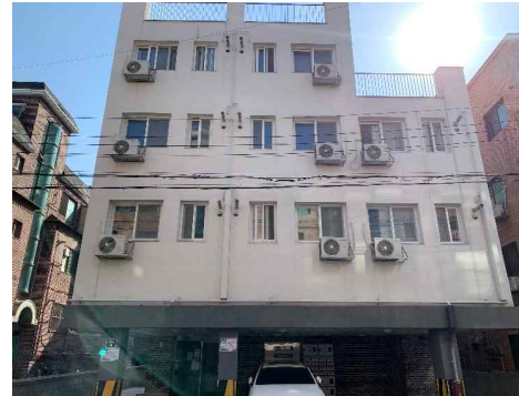
* 건물 전경 및 내부